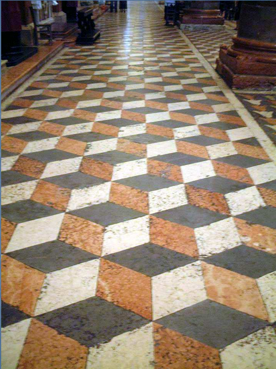
Santa Anastasia Verona (Italia)